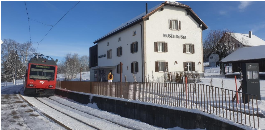
Musée du Ski, Gare Le Boéchet

Comme la plupart d'entre vous l'ont appris, le Musée du Ski, Le Boéchet, a ouvert ses portes à la fin septembre 2023. Son objectif est à la fois simple et ambitieux, parcourir l'histoire du ski de ses débuts à nos jours, du ski polyvalent au ski ultraspécialisé, du ski alpin au ski nordique, sans oublier les pratiques plus fun actuelles. En résumé, un premier espace accueille une exposition semi-permanente qui retrace l'évolution générale du ski et un second espace plus petit est réservé aux expositions temporaires.