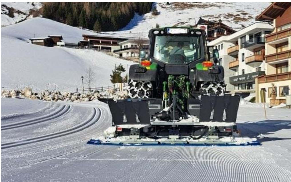
Rapprochement du ski de fond et des milieux agricoles

Dans ce monde touristique-sportif, le Centre nordique est appelé aujourd'hui à s'adapter et à se repositionner. Cela peut aller de la simple réduction de voilure à la disparition totale, en passant par mille variantes de collaboration et de regroupements judicieux. Plus que jamais, nombre de questions vont surgir à l'heure du renouvellement des engins de traçage, toujours plus chers, toujours moins utilisés ! Dans ce contexte, le choix va logiquement s'orienter vers des engins plus aptes à tracer par faible enneigement. Une synergie avec les milieux agricoles qui utilisent moins leurs tracteurs en période hivernale semble être une autre piste à explorer.