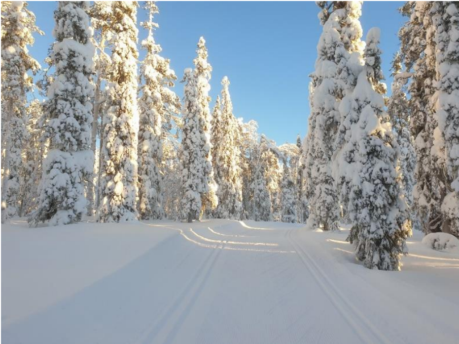
Hiver de rêve en Finlande.... janvier 24 Finlande Luosto

A l'heure du bilan, le manque de neige en Suisse romande a marqué la saison hivernale 23/24 si bien que la plupart des Centres nordiques ont eu des activités réduites, voire très réduites. Avec peu de jours d'ouverture, le ski de fond a tourné au ralenti et de nombreux skieurs n'ont pas chaussé les lattes cet hiver ce qui s'avère particulièrement problématique avec notre système de cartes saisonnières. Par chance, d'autres régions du pays, comme la Vallée de Conches ou les Grisons ont connu un bon hiver. Les mordus de ski de fond ont pu se rabattre vers ces sites privilégiés pour assouvir leur soif de kilomètres. Par contre, de nombreux skieurs, attachés à une «pratique plus locale» du ski de fond n'ont pas mis le pied sur les pistes