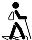
Marcheur avec raquettes