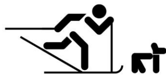
Skieur avec chien