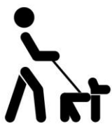
Marcheur avec chien